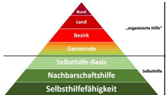
Abbildung 1: Pyramide der organisierten Hilfe

Die erste organisierte Hilfe und Ebene des Staatlichen Krisen- und Katastrophenschutzmanagements (SKKM) 4 beginnt auf der Gemeindeebene. Einerseits mit der Bürgermeisterin/dem Bürgermeister als erste/n behördliche/n Einsatzleiter/in . Zur Unterstützung steht die Feuerwehr zur Verfügung.